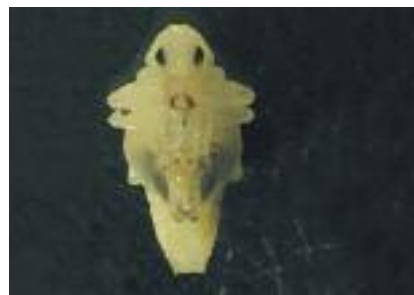
Abb. 22: Puppe kurz vor dem Schlüpfen von Lupinenblattrandkäfern