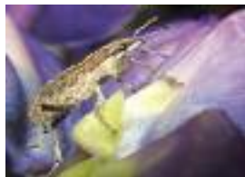
Abb. 18: S. gressorius