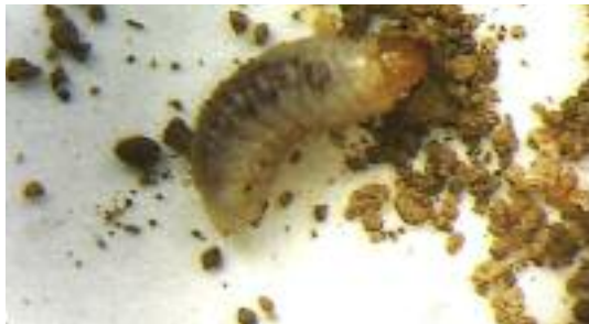
Abb. 20: Larve von Lupinenblattrandkäfern