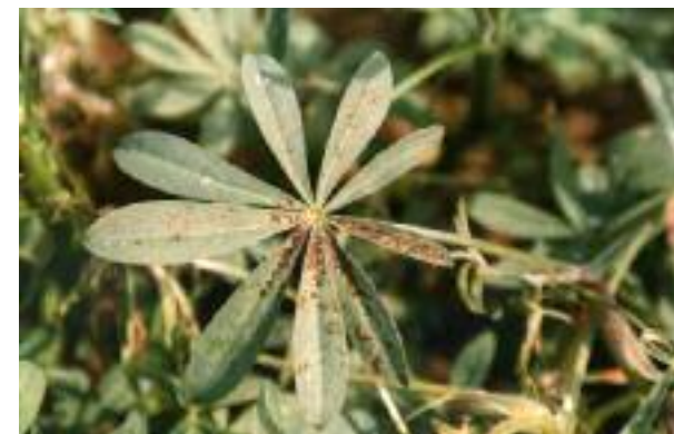
Abb. 2: Pleiochaeta setosa als Blattbefall an der Weißen Lupine