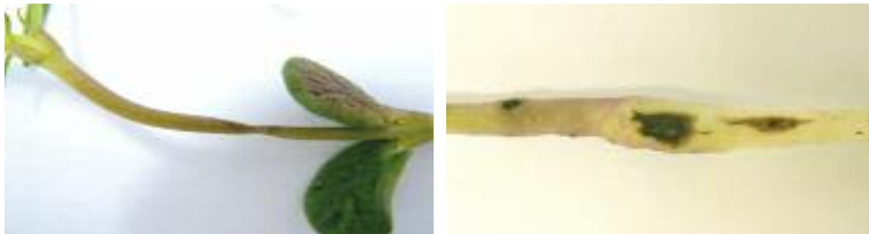
Abb. 13: Eingeschnürter Bereich eines Lupinenstängels (links) und Verbräunungen am Stängel (rechts) verursacht durch Pythium spp.

Ein Befall tritt vor allem im Keim- und Jungpflanzenstadium auf. Beginnend an den Wurzelspitzen kann er sich bis zum Wurzelhals erstrecken. Innerhalb weniger Tage nach Infektion knicken die Pflanzen durch die weichen, eingeschnürten Stängelbereiche (= Umfallkrankheit, Abb. 13) ein. Die erdnahen und unterirdischen Pflanzenteile sind verbräunt, teilweise verkümmert, eingeschrumpft und morsch (Abb. 14). Später infizierte Pflanzen sind weniger kräftig, vergilben oder vertrocknen. Die typischen Symptome in diesem Stadium sind welke oder vertrocknete Blätter (Abb. 14) und teilweise entlaubte Pflanzen.