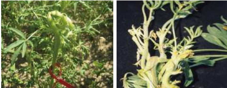
Abb. 4: Verdrehungen des Haupttriebes verursacht durch C. lupini