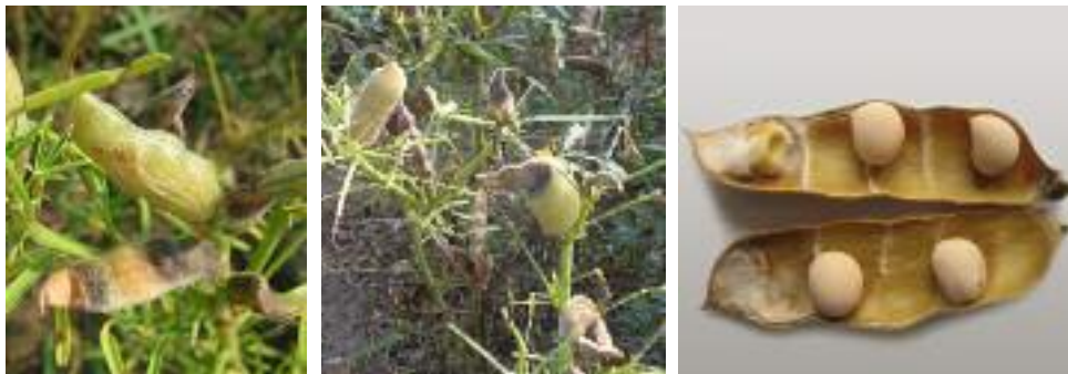
Abb. 6: Typische Brennflecken und Missbildungen an den Hülsen (links und mitte) sowie befallene Hülse von innen (rechts)