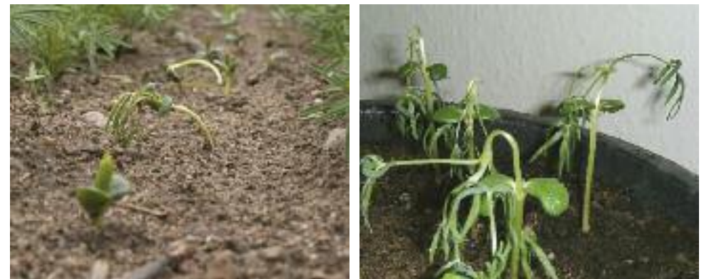
Abb. 3: Unspezifische Welkeerscheinungen (links) und erschlaffte Blätter (rechts) an jungen Pflanzen verursacht durch C. lupini

Die höchste Absterberate ist durch ein „inneres Vertrocknen“ der infizierten Pflanzen zwischen Keimlings- und Jungpflanzenstadium (6-8 Blätter) zu verzeichnen. In der weiteren Entwicklung sterben betroffene Triebe und Blüten in der Regel ab (Abb. 5). Infizierte, überlebende Pflanzen zeigen zur Reife hin kaum Symptome. Oftmals sind einzelne herabhängende Blättchen, ein Einrollen der Fiederblätter durch Absinken des Zellurgors, eine leichte Schiefstellung des Sprosses sowie deformierte oder fleckige Hülsen die einzigen Anzeichen für eine Infektion (NIRENBERG & FEILER 2003).