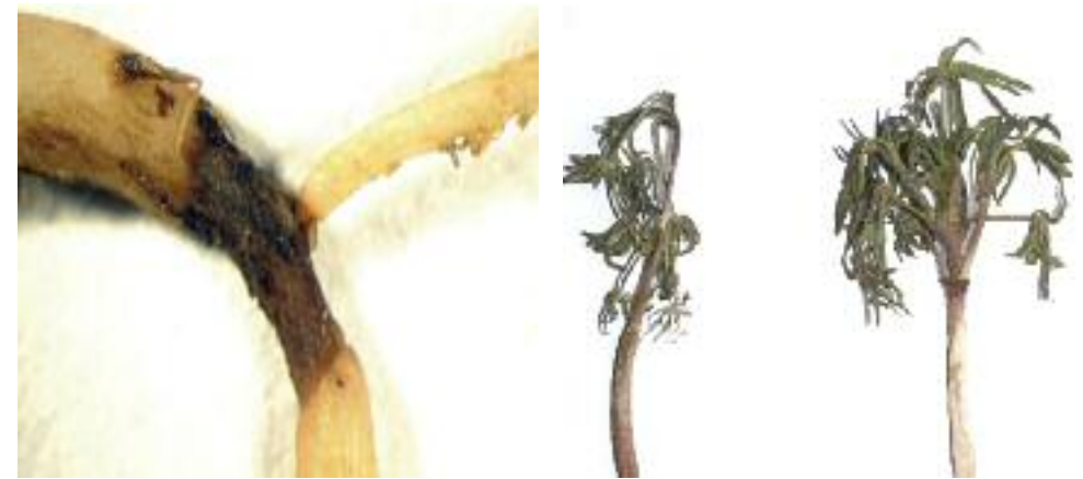
Abb. 14: Einschnürungen an der Wurzel und Fäule (links) und Welkeerscheinungen an der gesamten Pflanze (rechts) verursacht durch Pythium spp.