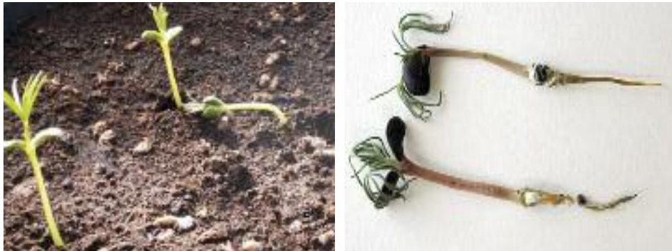
Abb. 9: Umfallen der jungen Pflanzen nach Sklerotinia-Befall durch ein weiches Hypokotyl (links) und weißliches, flockiges Myzel an der Wurzel (rechts)

Die Pflanzen haben fast immer eine bleiche, stängelumfassende Verfärbung. Triebe und Hülsen werden oberhalb der Befallsstelle gelb, notreif und sterben vorzeitig ab. Im Stängelinneren sind ein weißliches, flockiges Myzel und hellgraue, später schwärzliche, unregelmäßig geformte Sklerotien (Dauerkörper) zu finden. Die Mehrzahl der aus kontaminierten Körnern hervorgehenden Keimlinge stirbt noch beim Auflaufen ab (Abb. 9). Sie zeigen labile Stängel mit weicher und fauler Konsistenz, was zur Folge hat, dass die Pflanzen umkippen. Junge Pflanzen bilden vermehrt Seitenwurzeln aus, nachdem die Hauptwurzel abgestorben ist.