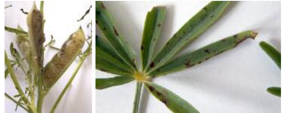
Abb. 1: Eingesunkene braune Flecken verursacht durch den Erreger der Braunfleckenkrankheit an den Hülsen (links) und am Blatt (rechts)

gesprenkelt aus (Abb. 1), und werden im weiteren Infektionsverlauf abgeworfen. COWLING (1988) unterscheidet zwischen der Braunfleckenkrankheit des oberirdischen Sprosses und einer durch den Erreger verursachten Wurzelfäule, die ca. 4 bis 5 Wochen nach der Aussaat durch Einschnürungen und Braunfärbung des Wurzelhalses die Jungpflanzen zum Absterben bringt.