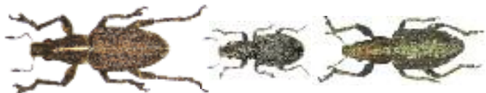
Abb. 17: Adulte Blattrandkäfer Sitona gressorius , S. lineatus und S. griseus (von links)

7 Tagen die Larven aus (Abb. 20). Mit abnehmender Temperatur und Feuchtigkeit verlängert sich die Zeit bis zum Schlüpfen der Larven. Die Larven ernähren sich von den Wurzelknöllchen und höhlen diese vollständig aus (Abb. 21). Ist das Knöllchen aufgefressen, gehen sie auf andere über. Die Verpuppung (Abb. 22) findet nach mehrwöchiger Fraßzeit in der oberen Bodenschicht statt. Die Altkäfer sterben im Laufe des Sommers ab. Zum Ende des Sommers, meist mit Beginn der Ernte, schlüpfen die Jungkäfer aus dem Boden (ANDERSEN 1937; GLAUNINGER & SCHMIEDL 1965). Die im Herbst geschlüpften Jungkäfer kommen erst im Frühjahr des folgenden Jahres zur Geschlechtsreife und Eiablage. Eine Ausnahme bildet S. gressorius , der noch im Herbst des gleichen Jahres fortpflanzungsfähig wird (ANDERSEN 1937). Im September/Oktober beziehen die Jungkäfer die Winterquartiere (GLAUNINGER & SCHMIEDL 1965)