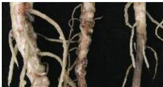
Abb. 21: Wurzelfraß durch die Larven