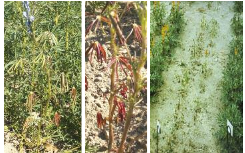
Abb. 7: Beginnende Welke und Verfärbungen der Blätter (links und mitte) verursacht durch F. oxysporum , Abb. 8: Fusarium anfällige Linie zwischen zwei resistenten Linien (rechts)

Die ersten sichtbaren Befallserscheinungen zeigen sich während der Blüte. Zuerst welken einige Blätter (Abb. 7), später weist die ganze Pflanze Welkeerscheinungen auf (Abb. 8), wobei die Wurzeln noch völlig intakt sein können. Schneidet man den Stängel einer Pflanze durch, ist eine charakteristische braune Verfärbung der Gefäße sichtbar. Hat das Welke stadium seinen Höhepunkt erreicht, setzt der Pilz sein Wachstum im übrigen Stängelgewebe fort und zerstört dieses, so dass auch äußerlich an der Pflanze braune Gewebspartien sichtbar werden. Auf den toten Stängelteilen bildet der Pilz die typischen rosa- bis lachs-farbenen Konidienlager aus.