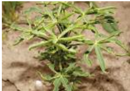
Abb. 19: Bogenfraß verursacht durch Blattrandkäfer an einer Lupinenpflanze