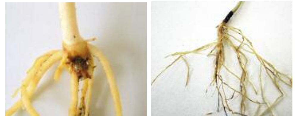
Abb. 12: Absterben der Hauptwurzel an jungen Pflanzen (links) und Vermorschungen der Hauptwurzel an älteren Pflanzen (rechts)

Das Vorkommen von Symptomen an Keimpflanzen verursacht durch die Erreger Fusarium spp. hängt von der Infektionsstärke am Samen und den Auflaufbedingungen ab. Häufig wird bereits der Keimling abgetötet. An jungen Pflanzen führt ein Befall zu bräunlichen Nekrosen und Vermorschungen an den Wurzeln (Abb. 12). Die Pflanzen welken und sterben schließlich ab. Auch ältere Pflanzen zeigen Vermorschungen im Wurzelbereich. Die Lupinen sterben aber meist nicht ab, sondern kompensieren den Verlust der Hauptwurzel durch Ausbildung von Sekundärwurzeln (Abb. 12). Die Keimfähigkeit ist bei einem Befall mit den o. g. Erregern deutlich herabgesetzt.