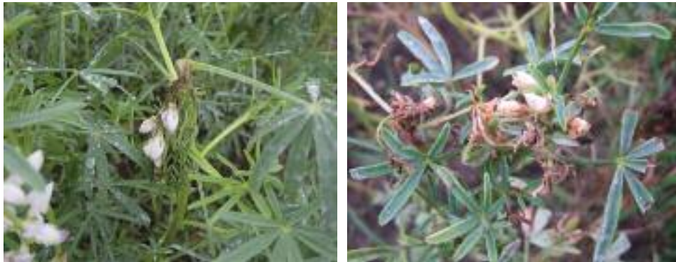
Abb. 5: Blattnekrosen und Abknicken des Blütenkopfes nach Infektion mit C. lupini