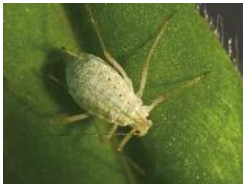
Abb. 23: Lupinenblattlaus ( Macrosiphum lbifrons )

konnte durch THIEME (1997) nicht bestätigt werden. Macrosiphum albifrons ist befähigt, bei Besiedlung „bitterer Lupinen“ Alkaloide in ihrem Körper zu akkumulieren und dadurch Toxizität gegen Prädatoren zu erwerben (WINK & WITTE 1991, EMRICH 1991).