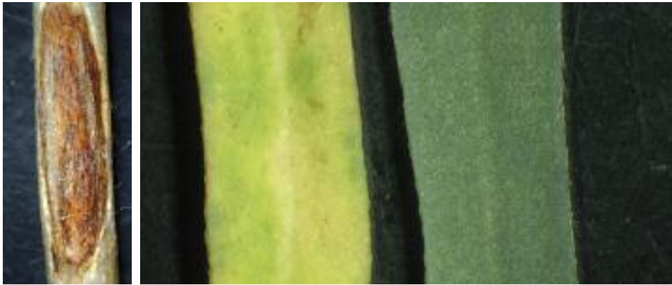
Abb. 16: Klassisch rötlicher Augenfleck am Hypokotyl (links) und deutliche Blattaufhellungen nach Rhizoctonia -Befall (rechts)