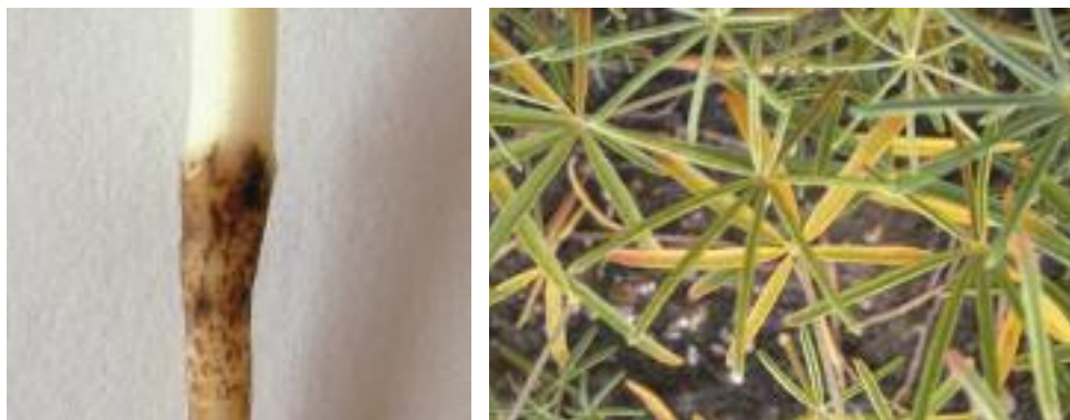
Abb. 15: Strichelsymptom an junger Wurzel (links) und unspezifische Nährstoffmangelsymptome an den Blättern infolge einer Gefäßverschlussung (rechts) verursacht durch Thielaviopsis basicola

Zuerst tritt an den Wurzeln eine Verbräunung in Form von lang gezogenen, dunkel gefärbten Strichen auf (Abb. 15). Diese entwickeln sich zu braunschwarzen Vermorschungen. Die Verfärbung ergibt sich dabei u.a. durch die reichlich sich entwickelnden, sehr dunklen Chlamydosporen. Die Wurzeln schrumpfen ein und werden mürbe. Das Wachstum der Blätter und Stängel sowie die Ausbildung der Blüten werden eingestellt und jüngere, stark infizierte Pflanzen sterben ab. Die Fiederblätter färben sich rot-gelb und zeigen unspezifische Nährstoffmangelsymptome und Kümmerwuchs (Abb. 15), einige ältere Fiederblätter fallen ebenfalls ab. An älteren, befallenen Pflanzen zeigt sich die Hauptwurzel mehr oder weniger faul und zerfällt beim Herausziehen aus der Erde.