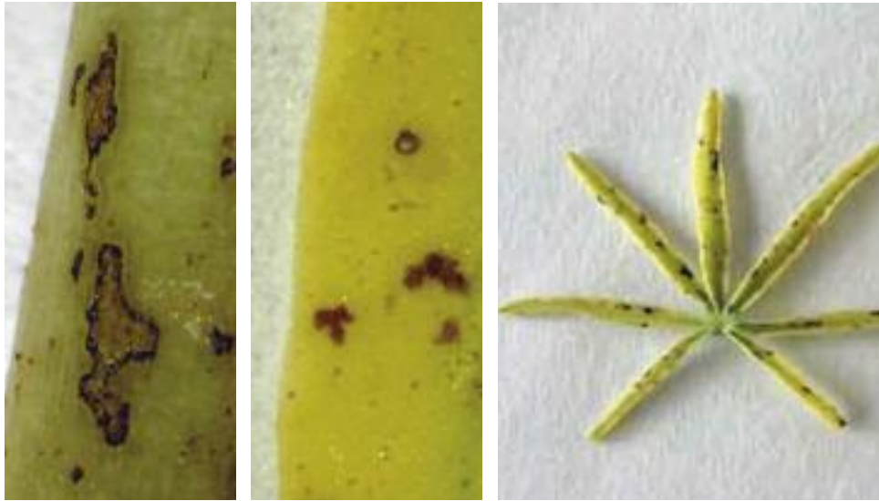
Abb. 10: Bräunliche Flecke am Stängel mit einem dunklen, scharf abgegrenzten Rand (links) und Vergilbungen im Bereich der Fiederblätter (mitte) verursacht durch Phoma spp., Abb. 11: Bräunliche Flecke am Fiederblatt verursacht durch Phoma spp. (rechts)